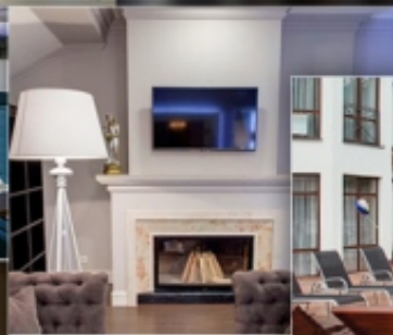
ГОТЕЛЬ ГЕОРГ ПАРК