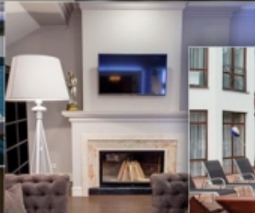
ГОТЕЛЬ ГЕОРГ ПАРК